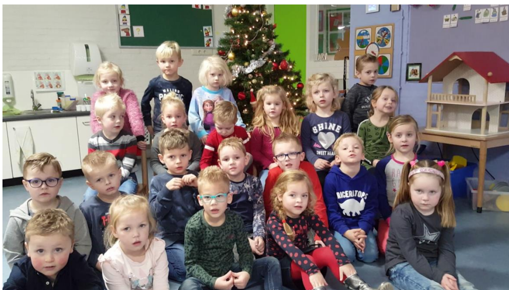
Op het moment dat de foto werd gemaakt, waren niet alle kinderen op school